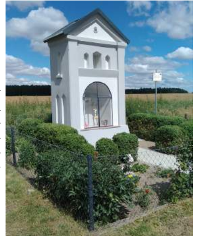
Kapliczka w Siemysłowie

Siemysłów – w kapliczce pochodzącej z początku XX w. zostały przeprowadzone prace konserwatorskie tzn. izolacja ścian fundamentowych, tynki zewnętrzne i wewnętrzne po wcześniejszym oczyszczeniu i zabezpieczeniu ścian, pokrycie dachowe oraz stolarka. Poza zrobieniem obrzeża betonowego, nawierzchni żwirowej i trawnika na zewnątrz zostało jeszcze wykonane zabezpieczenie antykorozyjne ogrodzenia.