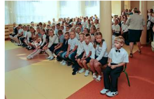
Fotografie przedstawiają rozpoczęcie roku w SP Polkowskim oraz powitanie roku szkolnego w SP w Domaszowicach.