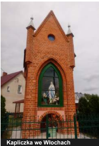
Kapliczka we Włochach

Włochy – kapliczka z przełomu XIX i XX w., w której została przeprowadzona izolacja ścian fundamentowych, pokrycie dachowe oraz konstrukcja drewniana więźby dachowej zostały poddane pracom renowacyjnym. Wnęki kapliczki zostały oczyszczone i odnowione, po czym pomalowane. Okno zostało odrestaurowane włącznie z uzupełnieniem okuć. Istniejące ogrodzenie również zostało poddane pracom renowacyjnym. Ściany zewnętrzne częściowo zostały oczyszczone, naprawione i pomalowane, a częściowo poddane renowacji - ściany z cegły klinkierowej. Wykonano obrzeża betonowe, nawierzchnię żwirową i trawnik, ponadto wykonano renowację schodów i podestu przed kapliczką. Przeprowadzono renowację figury oraz polichromii ściennej we wnęce górnej kapliczki.