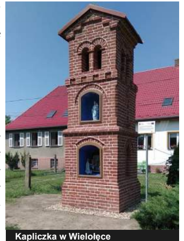
Kapliczka w Wieloleśce

Wieloleśka – kapliczka z XIX w., w której została wykonana izolacja ścian fundamentowych, dach został pokryty blachą miedzianą, wewnątrz ściany zostały oczyszczone i pomalowane po wcześniejszym ich przygotowaniu. Wykonano renowację istniejących okien drewnianych wraz z uzupełnieniem okuć. Renowacji poddano także elementy stalowe dzwonnicy oraz krzyż. Ściana zewnętrzna z cegły klinkierowej także została poddana renowacji. Na zewnątrz wykonano obrzeże betonowe, nawierzchnię żwirową i trawnik.