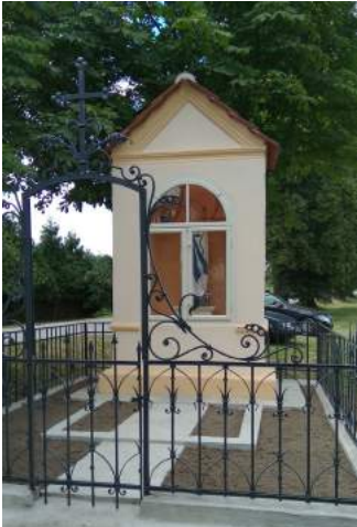
Kapliczka w Strzelcach

Kapliczka w Strzelcach – kapliczka została gruntownie odremontowana. Wykonano izolację ścian fundamentowych, tynki na zewnątrz i wewnątrz, pokrycie dachowe, stolarkę. Obrzeże betonowe, nawierzchnię żwirową i trawnik. Ponadto wykonano renowację ogrodzenia wraz z cokołem betonowym, detali z zaprawy i elementów sztukatorskich oraz schodów granitowych. Przeprowadzono renowację figury.