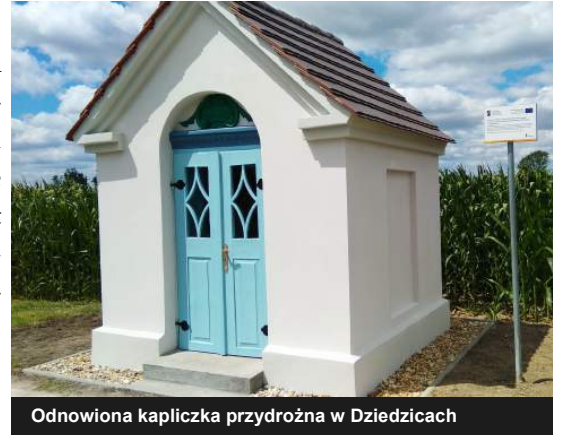
Odnowiona kapliczka przydrożna w Dziedzicach

D ziedzice – remont kapliczki rozpoczęły prace izolacyjne ścian fundamentowych, kolejno wykonano tynki zewnętrzne i wewnętrzne (po wcześniejszym przygotowaniu powierzchni), pokrycie dachowe i stolarkę. Wszystkie elementy zostały odpowiednio zabezpieczone tak, aby ząb czasu zbyt wcześnie ich nie nadgryzł. Na zewnątrz został odrestaurowany podest, wykonana nawierzchnia żwirowa i trawnik. Przeprowadzono renowację figurki.