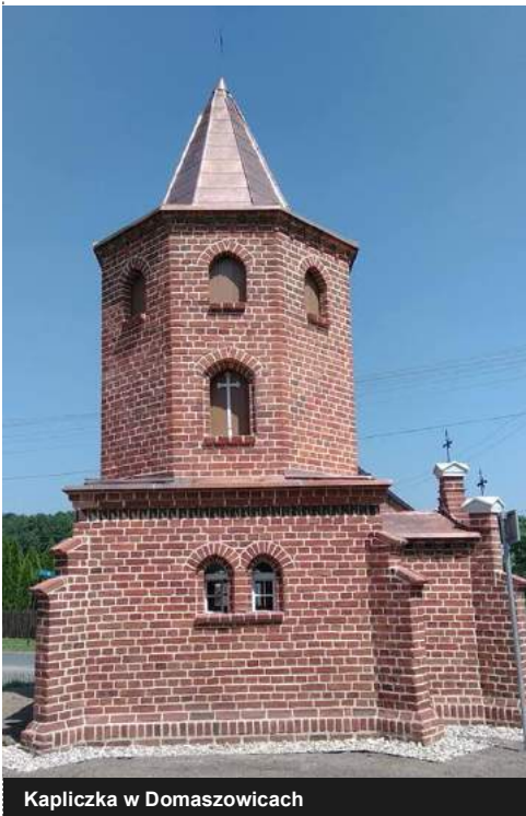
Kapliczka w Domaszowicach

P olkowskie – odbudowa dzwonnicy zaczęła się od szeregu prac rozbiórkowych polegających na skuciu i utylizacji tynków wewnętrznych i zewnętrznych i demontażu elementów więźby dachowej. Kolejno przystąpiono do prac ogólnobudowlanych, w ramach których wykonano izolację ścian fundamentowych, odtworzono konstrukcję więźby dachowej oraz pokrycia dachowego z gontów drewnianych wraz z montażem wiatrowskazu, przeprowadzono roboty wewnętrzne na wszystkich trzech kondygnacjach (odbijanie tynków, izolowanie przeciwwilgociowe, uzupełnianie i naprawa tynków, gruntowanie i malowanie, kładzenie posadzki, wzmacnianie belek w stropach drewnianych, kładzenie podłóg drewnianych z desek, impregnacja grzybobójcza, owadobójcza oraz ogniochronna). Została odtworzona stolarka okienna i drzwiowa. Na zewnątrz zostały odbite tynki, powierzchnia została oczyszczona i wzmocniona preparatami do tego przeznaczonymi, następnie powierzchnia została zagruntowana i pomalowana. Zostały wykonane obrzeża betonowe, nawierzchnia żwirowa i trawnik. Wykonano też metalowe ogrodzenie.